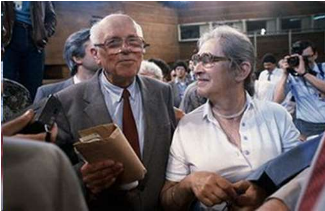
1987 – Иосифу Бродскому присудили Нобелевскую премию по литературе.